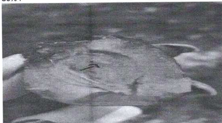
Viespea semintelor de prun ( Eurytoma schreinerii )

Daunătorul prezintă 2 generații pe an și iernează în stadiul de larvă, în interiorul unui cocon matasos, la baza pomilor pe sub frunzele căzute sau în crăpături ale scoarței, larvele primei generații se hrănesc cu samburii fructelor verzi, care în urma atacului nu se mai dezvoltă și cad. Larvele celei de a-II-a generație se hrănesc cu fructele aflate în fază de coacere, în care sapa galerii în jurul samburilor în care lasă resturi de hrană și excremente brun-negricioase. Picăturile de goma (clei), prezente pe fructe, sunt caracteristice acestui daunător. A-II-a generație poate produce pierderi de până la 80%.